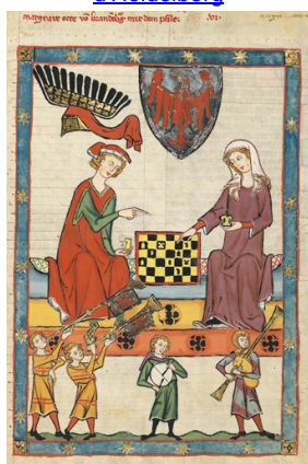
Du chatrang au jeu d'échecs, le plateau est devenu bicolore

Cod. Pal. germ. 848, 1300-1340, Universitätsbibliothek d'Heidelberg