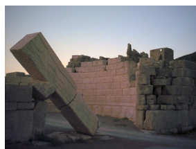
La porte dite d'Arcadie de la ville de Messène, ancienne cité grecque fondée en 370/69 av. J.-C.

à la Maison des Associations du 7 ème VOIR LA DATE DANS LA RUBRIQUE "AGENDA"