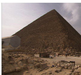
La grande pyramide de Khéops

Voir les prochaines dates dans notre rubrique "Agenda" ou commandez-nous une intervention dans le lieu de votre choix