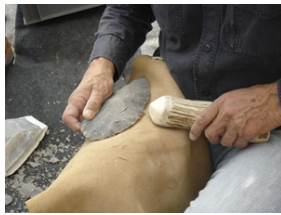
Taille expérimentale d'un biface dans un bloc de silex avec percuteur en bois de cervidé

Qui n'a pas rêvé d'emprunter une machine à voyager dans le temps pour assister aux premiers pas de l'Humanité ?