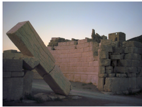
La porte dite d'Arcadie de la ville de Messène, ancienne cité grecque fondée en 370/69 av. J.-C.